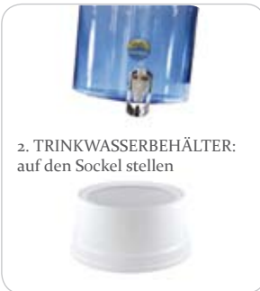
2. TRINKWASSERBEHÄLTER: auf den Sockel stellen

1. Montieren Sie den WASSERHAHN. Die zwei Dichtungsringe werden jeweils an der Innen- und Außenseite des Trinkwasserbehälters befestigt. Das Trinkwassergefäß sollte im Bereich der Silikonichtung trocken sein, um spätere Undichtigkeit zu vermeiden!