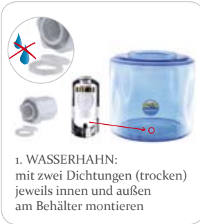
1. WASSERHAHN: mit zwei Dichtungen (trocken) jeweils innen und außen am Behälter montieren

Nach der Vorbereitung montieren Sie Ihr Wasserfiltersystem einfach nach folgenden Schritten: