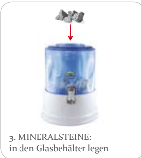
3. MINERALSTEINE: in den Glasbehälter legen

2. Stellen Sie den TRINKWASSERBEHÄLTER auf den SOCKEL.